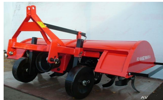
Грунтофреза – 50,4 тис грн