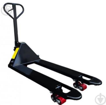
Візок гідравлічний – 14,7 тис грн