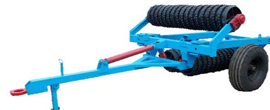
Каток зубчато-кільчатий – 225,0 тис грн