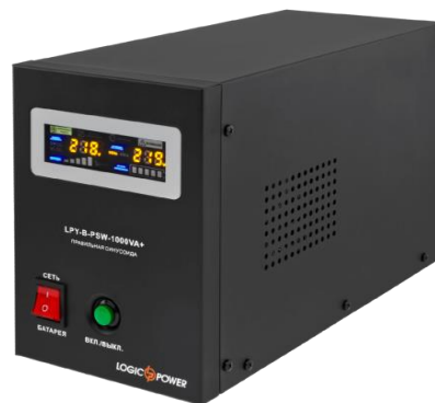
Безперебійник – 9,6 тис грн