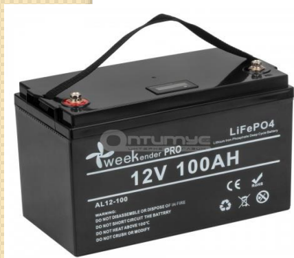
Акумулятор – 13,8 тис грн