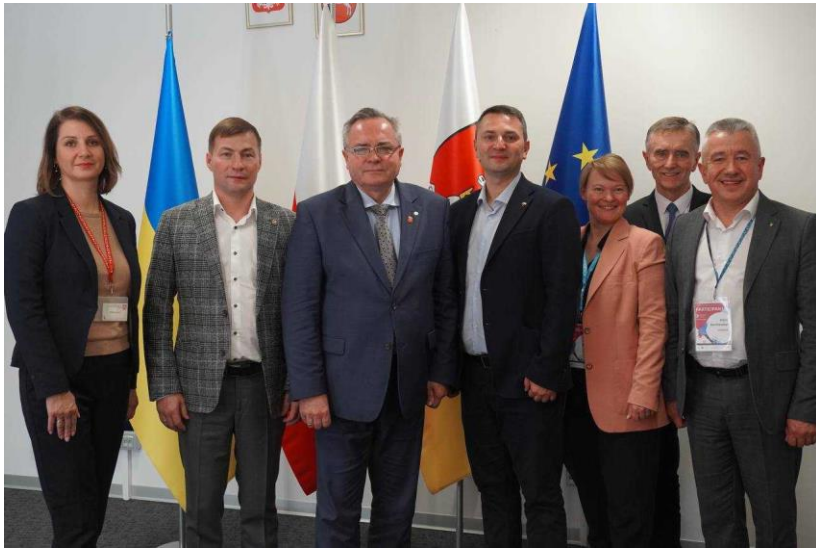
Голова обласної ради на Конгресі Транскордонної Співпраці