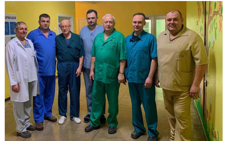
Хірурги дитячої обласної лікарні разом із польськими колегами