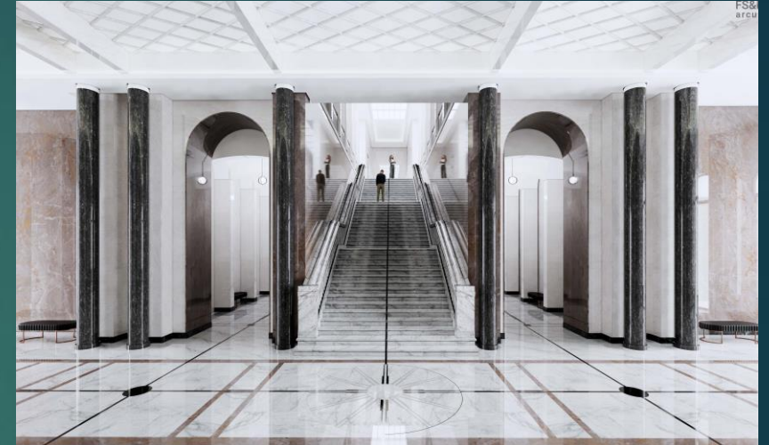
Реконструйований інтер'єр палацу Брюля