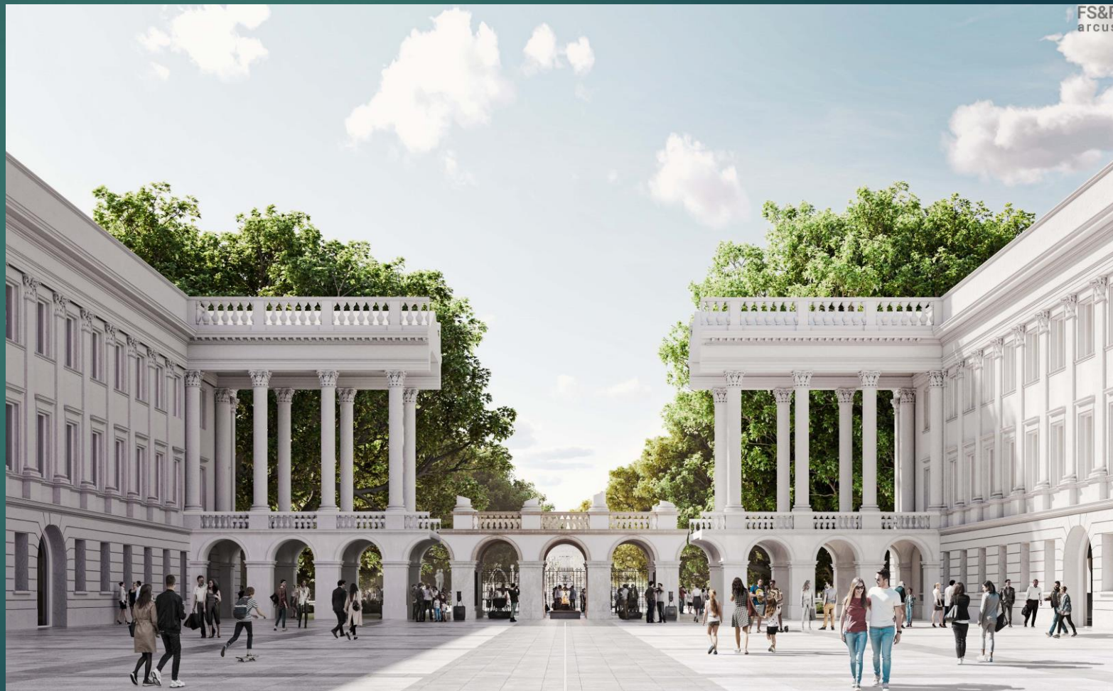
КОЛОНА З ЧАСТИНОЮ МОГИЛИ НЕВІДОМОГО ВОЇНА