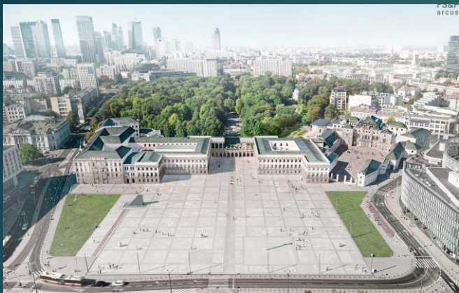
ВИД НА ПЛОЩУ ПІЛСУДСЬКОГО ТА САСЬКИЙ САД

(2023) Конкурс на відбудову зруйнованих у 1944 році; Саксонський палац, палац Брюль, кам'яниці на вулиці Крулевській; для резиденції Сенату Республіки Польща, Мазовецького воєводи, виставкових залів і виставок; 2 місце: FS&P ARCUS – Ingarden&Evy; Головний архітектор Mariusz Ścisło