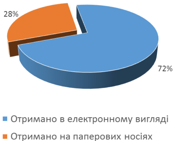
Спосіб надходження запиту

Найбільш запитуваною була інформація статистично-довідкового характеру: надійшло 23 запити відповідного змісту, або 92 % від загальної кількості надісланих до Комітету запитів на інформацію. Разом із тим, було отримано лише 2 запити стосовно надання правової інформації, що склало 8 % від їх загальної кількості.